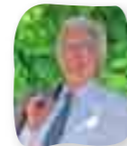
Dr Raymond Abrines

De façon contradictoire les élus de l'opposition s'inquiètent d'un déficit d'investissement de 2,5 millions d'euros, tout en ajoutant « qu'une ville qui n'investit plus est une ville qui se meurt ».