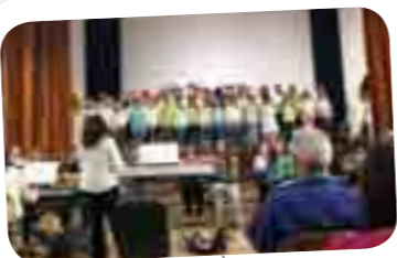
Spectacle Irlandais À l'Unisson