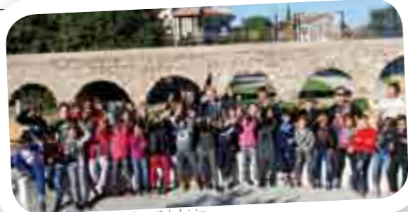
Vacances à l'Accueil de loisirs