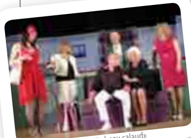
Pièce de théâtre «Un beau salaud»