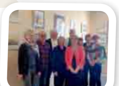
Exposition «Le printemps de l'Aquarelle»