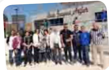
Finale Tournoi «Les Joyeux Boulomanes»