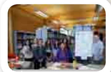
Stage de dessin «Manga»