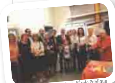
Exposition du Musée de l'École Publique