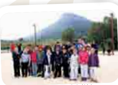
Concours enfants - La Boule Farlèdoise