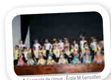
Spectacle de cirque - École M.Gensollen