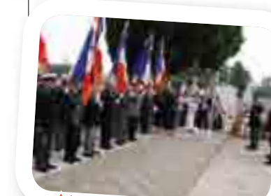
Journée nationale de la Déportation