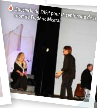
Spectacle de l'AFP pour le centenaire de la mort de Frédéric Mistral