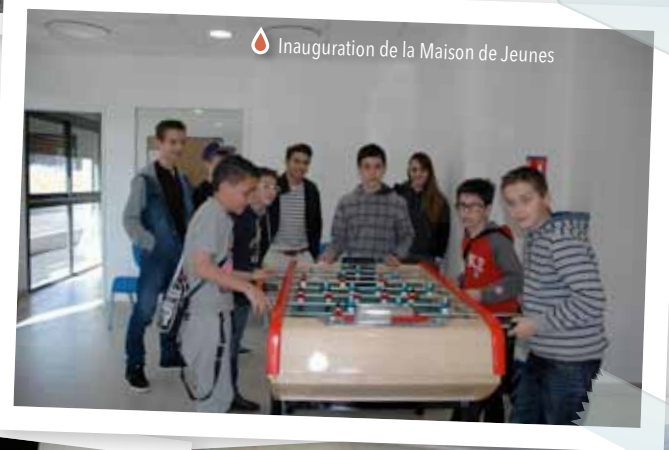
Inauguration de la Maison de Jeunes