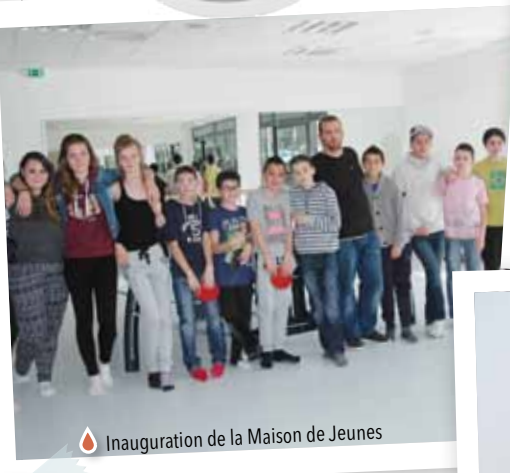
Inauguration de la Maison de Jeunes