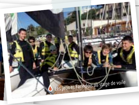
Les jeunes Farlédais au stage de voile