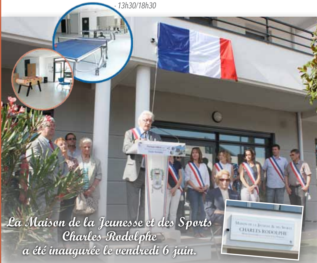
La Maison de la Jeunesse et des Sports Charles Rodolphe a été inaugurée le vendredi 6 juin.

Pour consulter les tarifs pendant les vacances scolaires, rendez-vous sur www.lafarlede.fr