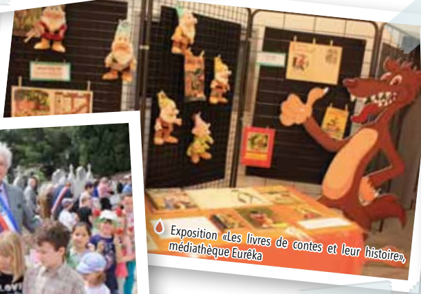
Exposition «Les livres de contes et leur histoire», médiathèque Euréka