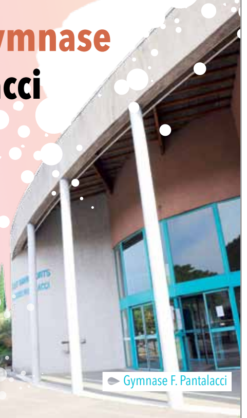
Gymnase F. Pantalacci