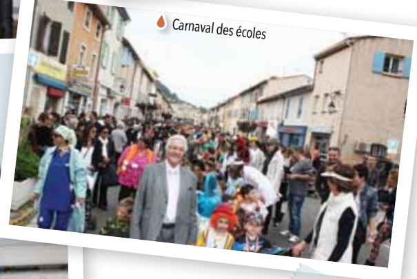
Carnaval des écoles