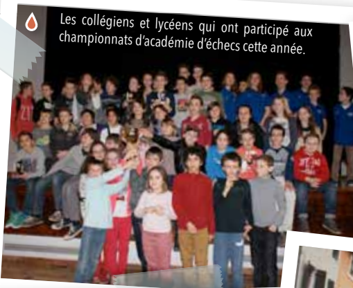
Les collégiens et lycéens qui ont participé aux championnats d'académie d'échecs cette année.