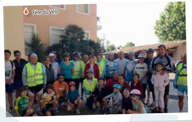
Fête du Vélo