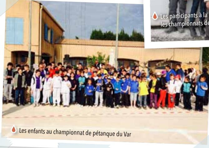
Les enfants au championnat de pétanque du Var