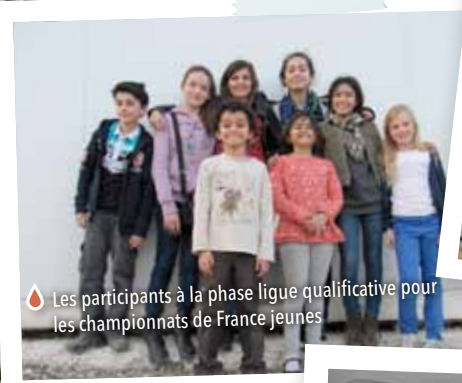
Les participants à la phase ligue qualificative pour les championnats de France jeunes