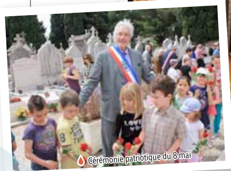
Cérémonie patriotique du 8 mai