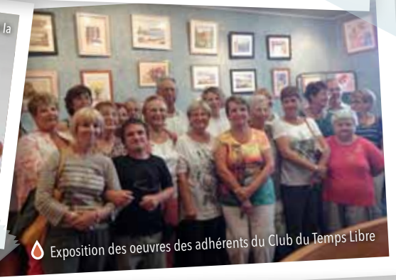
Exposition des oeuvres des adhérents du Club du Temps Libre