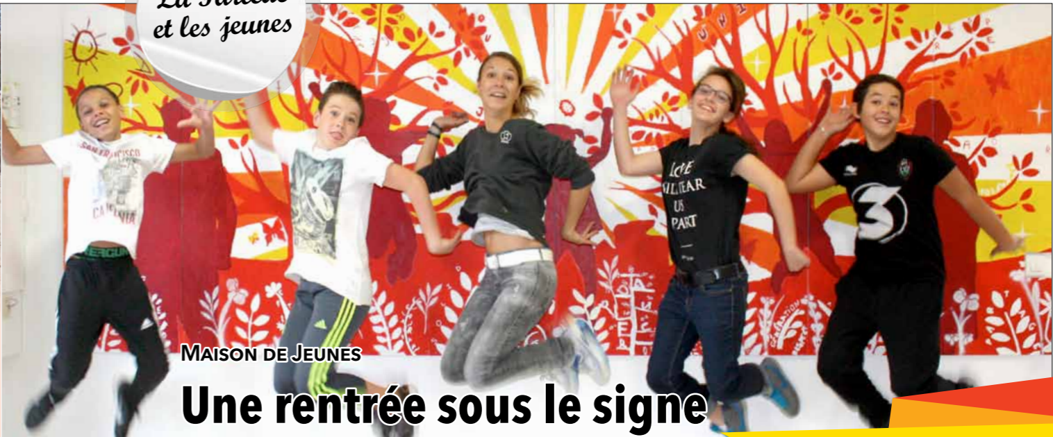
MAISON DE JEUNES

▶ Depuis septembre 2015, les communes de La Farlède et Solliès-Pont mutualisent, sous forme d'échange, le personnel et le matériel nécessaires à l'optimisation du fonctionnement de leurs équipements sportifs respectifs. Ainsi, l'entretien du terrain en pelouse synthétique du stade Jacques Astier à La Farlède et celui de la piste d'athlétisme en stabilisé du stade Jean Murat à Solliès-Pont sont réalisés par des agents disposant de tracteurs et machines adaptés à la spécificité de ces surfaces, diminuant ainsi les coûts d'entretien.