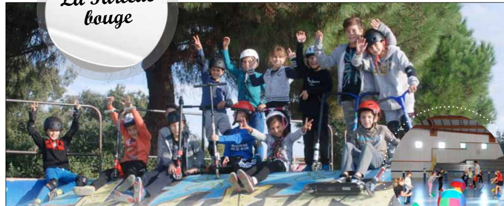
ÉCOLE MUNICIPALE DES SPORTS