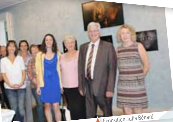
Exposition Julia Bénard