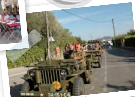
Fête de la Libération de La Farlède