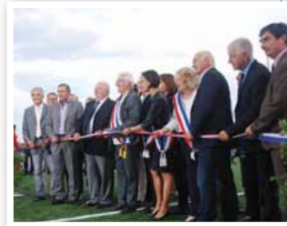
Coupe du ruban par Monsieur le Maire, entouré de son équipe municipale, des officiels et des personnes ayant participé au projet.

CETTE JOURNÉE D'INAUGURATION A ÉTÉ LE FRUIT DU TRAVAIL DES SERVICES COMMUNAUX, CONJUGUÉE AVEC L'ENTRAIN SANS FAILLE DES FARLÉDOIS, PETITS ET GRANDS. PRÈS DE 600 PERSONNES SE SONT RÉUNIES AU STADE JACQUES ASTIER POUR CÉLÉBRER LA MÉMOIRE D'UN HOMME QUI S'EST ENGAGÉ DURANT TOUTE SA VIE POUR SA COMMUNE ET LE BIEN-ÊTRE DE SES CONCITOYENS AVEC PASSION.