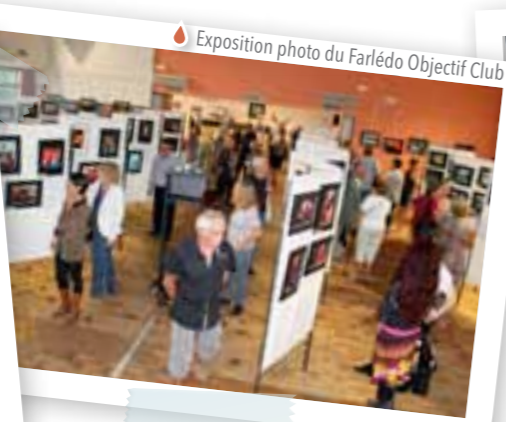
Exposition photo du Farlédien Objectif Club