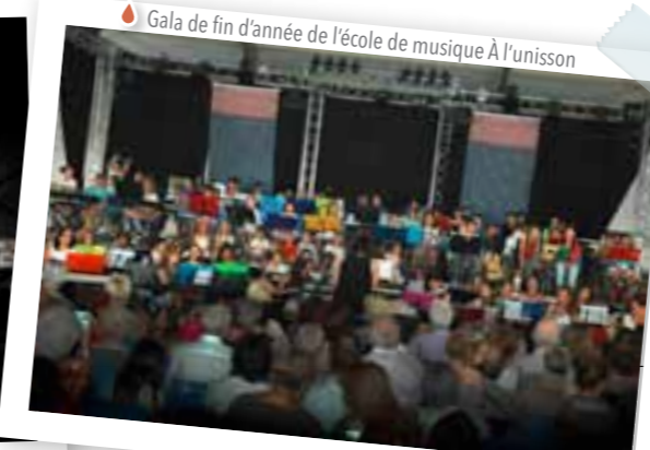
Gala de fin d'année de l'école de musique À l'unisson

Éditeur : Ville de La Farlède - Hôtel de Ville - 83210 La Farlède Directeur de publication : D' Raymond Abrines Conception & rédaction : Service communication Impression : Marim Imprimerie Imprimé sur un papier respectueux de l'environnement