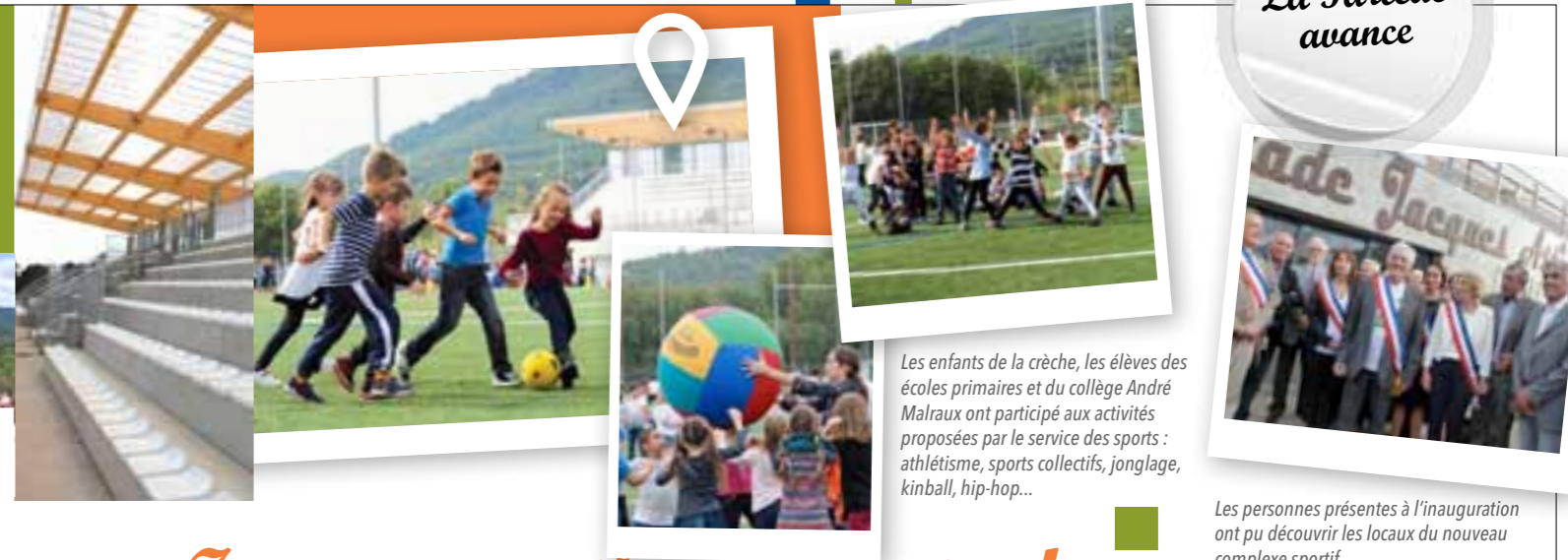
Les enfants de la crèche, les élèves des écoles primaires et du collège André Malraux ont participé aux activités proposées par le service des sports : athlétisme, sports collectifs, jonglage, kinball, hip-hop...

Un stade de football, un terrain d'échauffement et cinq boulodromes, autant d'éléments réunis à proximité de l'entrée de ville et du collège, répondant ainsi aux besoins des associations sportives farlèdoises et des scolaires.