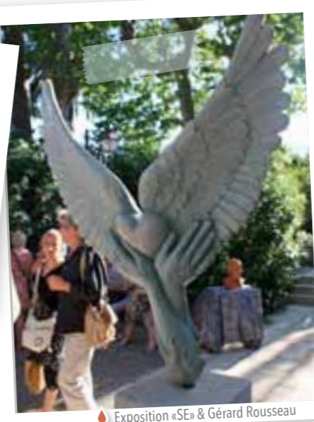
Exposition «SE» &amp; Gérard Rousseau