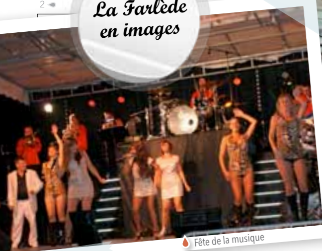
Fête de la musique