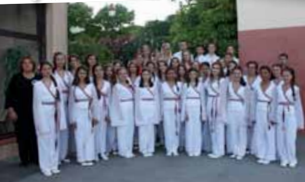
Festival des chorales