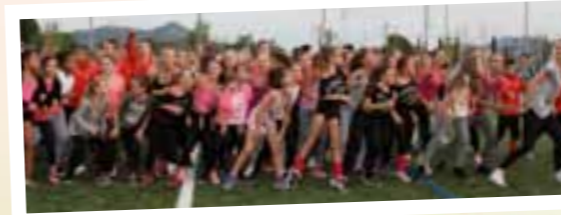
Les danseurs des écoles de danses farlèdoises ont fait leur show ! Tous en rythme au centre du stade, ils ont effectué une flashmob face aux spectateurs qui ont rapidement rempli les tribunes.