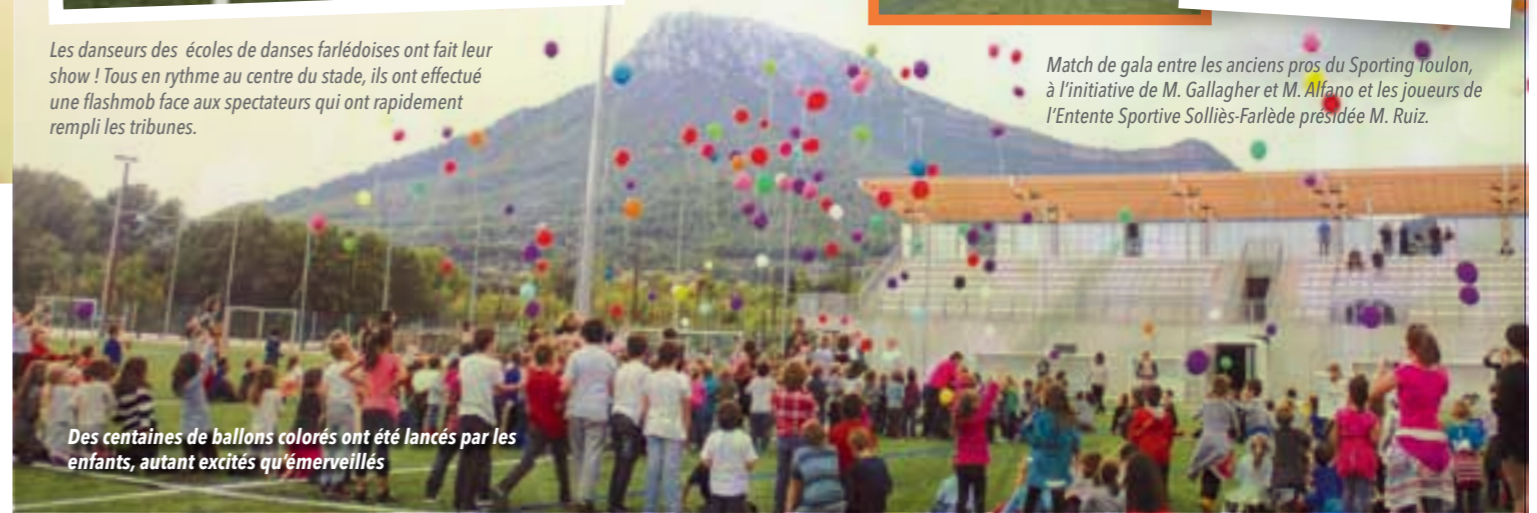
Des centaines de ballons colorés ont été lancés par les enfants, autant excités qu'émerveillés