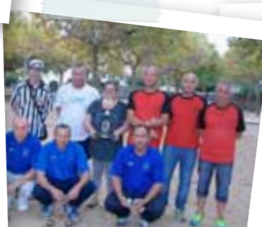
Concours de pétanque Matraglia